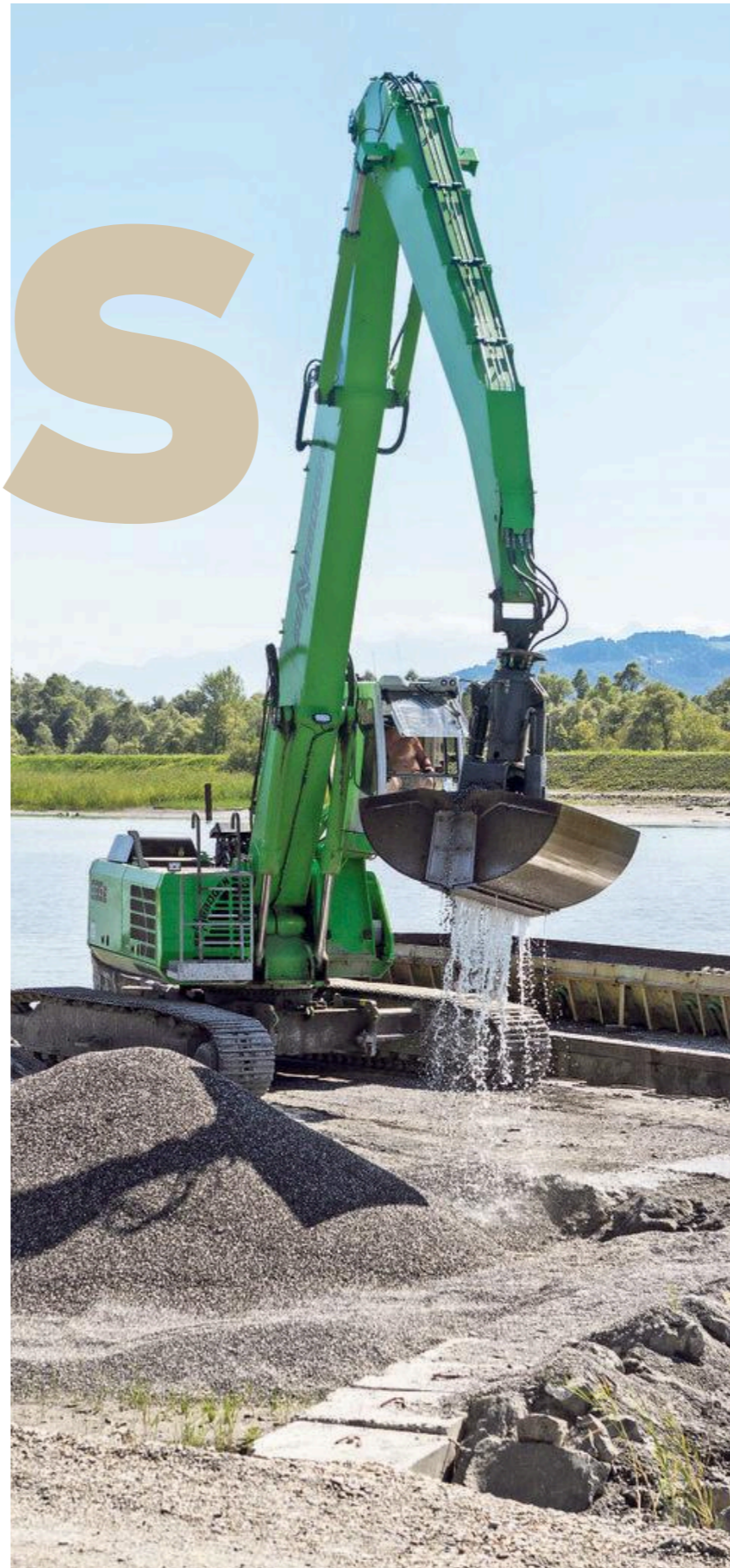
Am Rheinufer wird ein Schiff mit Kies entladen